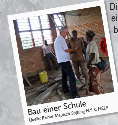
Bau einer Schule

Die Spender spenden für ein ganz konkretes Schulbau-projekt.