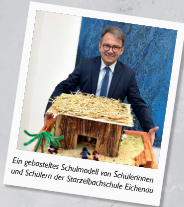
Ein gebasteltes Schulmodell von Schülerinnen und Schülern der Starzelbachschule Eichenau

Ziel der Initiative ist es, Menschen durch Bildung eine Zukunft in ihrer Heimat zu ermöglichen und Perspektiven vor Ort zu schaffen. Die Lebensbedingungen in den Ländern des globalen Südens gehen uns alle an. Von der Idee, auch auf kommunaler Ebene tätig zu werden, bin ich überzeugt. Deshalb möchte ich die Initiative „1000 Schulen für unsere Welt“ unterstützen und mit Hilfe von Spenden aus dem Landkreis Fürstenfeldbruck die umseitig genannten Schulbauten finanzieren.