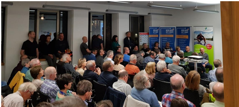
volles Haus beim PV Vortrag in der vhs Fürstfeldbruck.