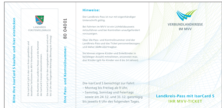
Landkreis-Pass Fürstentfeldbruck (Muster)

Beantragen Sie Ihren Landkreis-Pass am besten persönlich im Landratsamt Fürstentfeldbruck, Bürgerservice-Zentrum Adresse: Münchner Str. 32, 82256 Fürstentfeldbruck Geöffnet: Mo - Do von 8 bis 18 und Fr von 8 bis 16 Uhr Telefon: (08141) 519-999, E-Mail: bsz@lra-ffb.de Web: www.lra-ffb.de/amt-service/buergerservice-zentrum