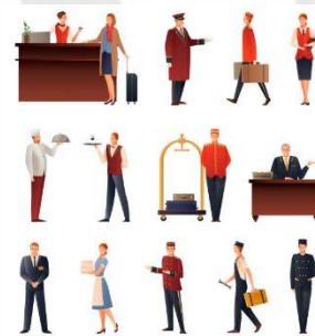
Hotel- und Gaststättengewerbe