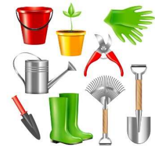
Garten- und / oder Landschaftsbau